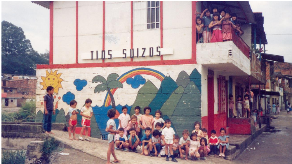
Sitz von Presencia im Armenviertel La Iguaná in Medellín